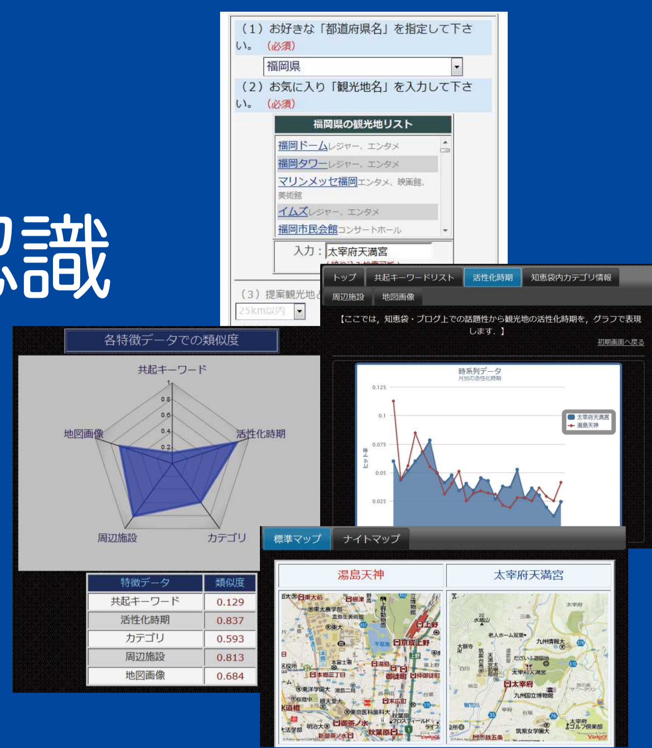
観光情報分析システム