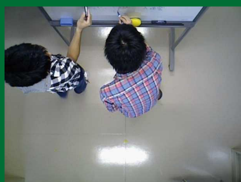
立ち位置や二人の距離、作業内容などから協力の度合いを推定