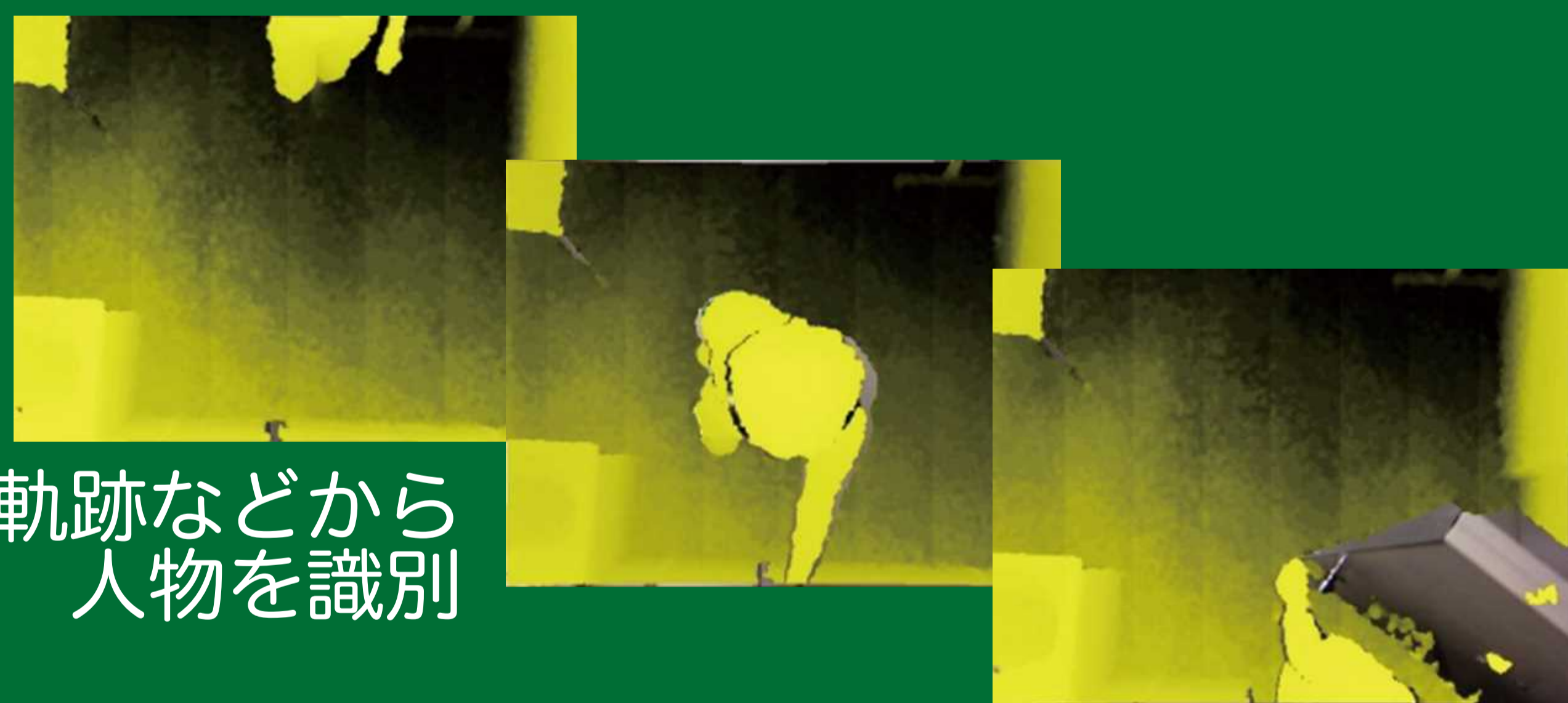
移動の軌跡などから人物を識別